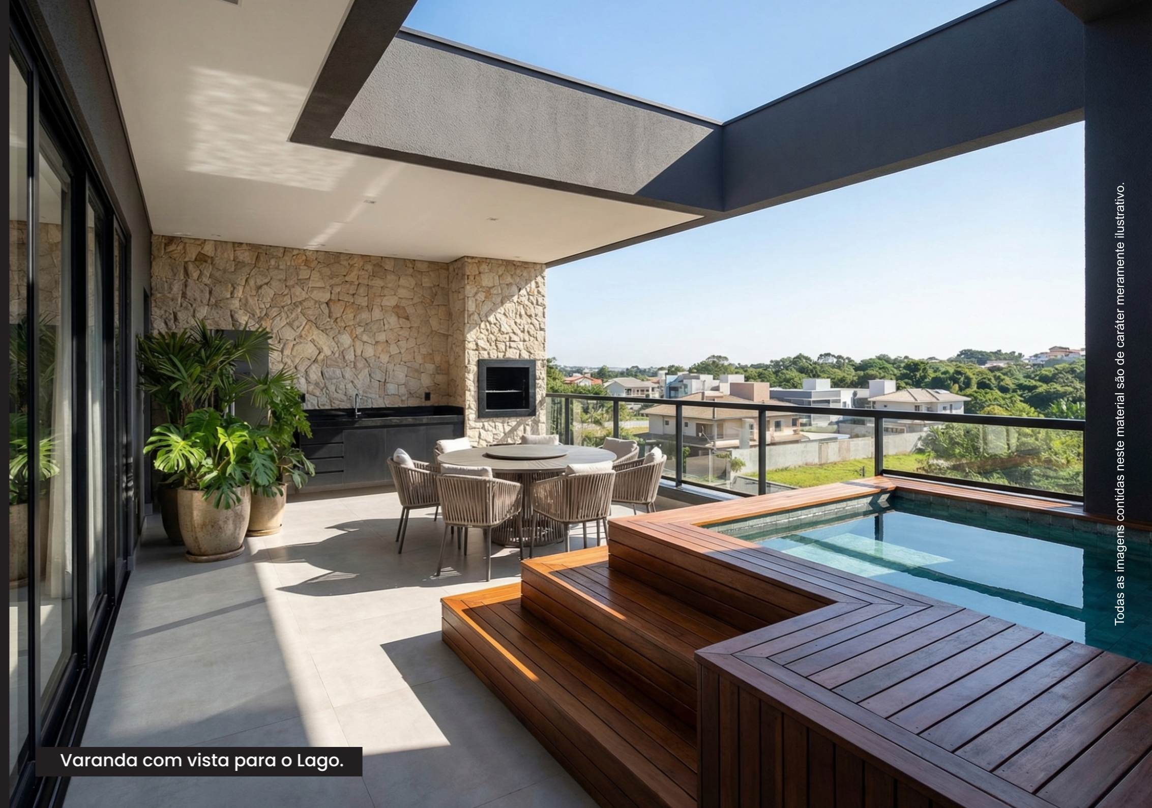
Varanda com vista para o Lago.

Área Privativa = 184,02 m 2 + 3 Vagas de garagem. | Área total = 323,44 m 2